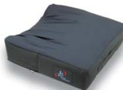
J2 ディープクッション