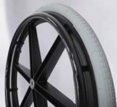
プラスチックコートハンドリム

ブリージーウルトラヘミは、超低床から低床までの最適なシート高と除圧用クッションや快適なバックサポートとの組み合わせが可能です。