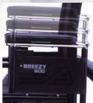
高さ調整アームレスト

ブリージーウルトラヘミのメーカーであるサンライズメディカル社は、世界的なシーティング用のクッションとバックのトップブランドJAYのメーカーでもあります。快適性の提供から褥瘡(床ずれ)予防と再発防止のためのクッションの数々、安定性の悪い方や円背などの変形のある方に対応するバックサポートの数々。使われる方に最適なシーティングとの組み合わせで「車いすが最も快適な場所」になります。