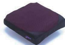
エクストリームクッション