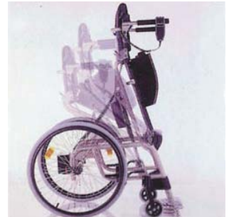
簡単なボタン操作でスムーズ に立ち上がることが可能