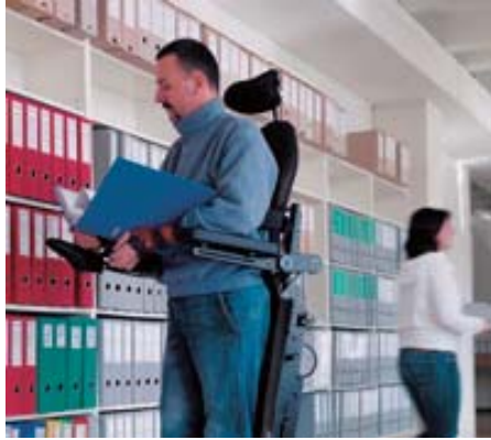
※写真のフレームカラーはレッド