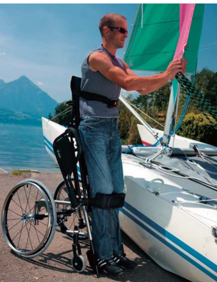
※写真のフレームカラーはプラチナ