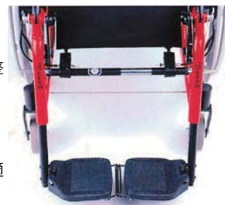
調節可能なフットプレート