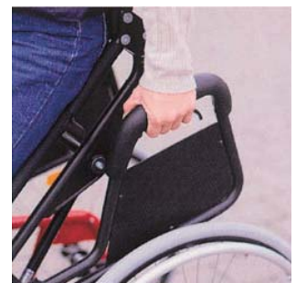
3回のプッシュアップで 立ち上がれます

軽量コンパクトに設計されているため、日常用車いすとしても快適な走行性を発揮します。