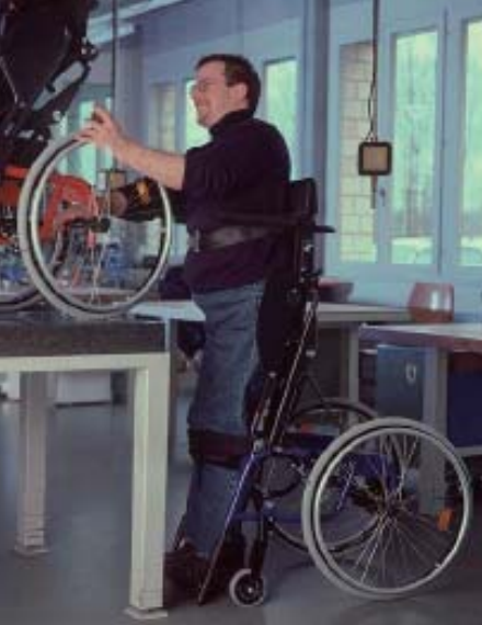
※写真のフレームカラーはブルー