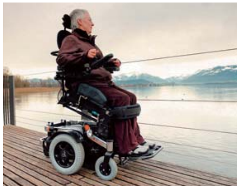
※写真のフレームカラーはプラチナ