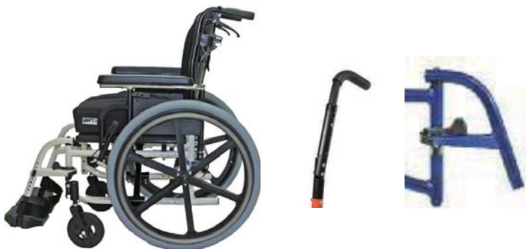
介助者用ブレーキ付きモデル 角度調整式バックレスト（ブッシュハンドル） スイングイン/アウト式ハンガー