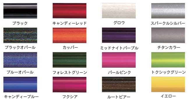
ブラック キャンディーレッド グロウ スパークルシルバー ブラックオパール カッパー ミッドナイトパープル チタンカラー ブルーオパール フォレストグリーン パールピンク トクシクグリーン キャンディーブルー フクシア ルートビア イエロー