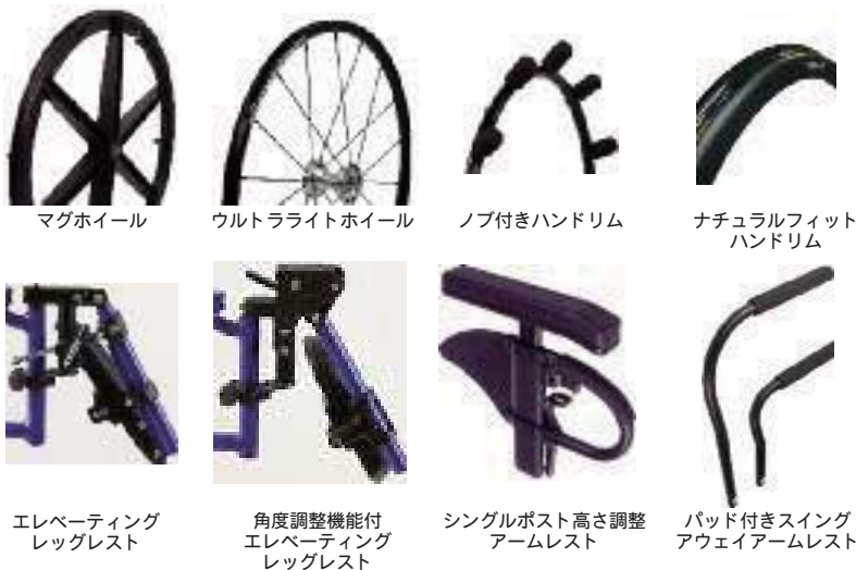
マグホイール ウルトラライトホイール ノブ付きハンドリム ナチュラルフィットハンドリム エレベータリングレッグレスト 角度調整機能付エレベータリングレッグレスト シングルポスト高さ調整アームレスト パッド付きスイングアウェイアームレスト