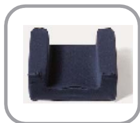
クッション (成長対応・ コントウア型など)