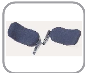
ラテラルサポート (体幹パッド)