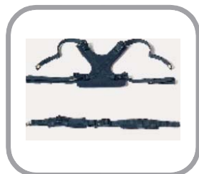
ハーネスベルト 及び 骨盤ベルト