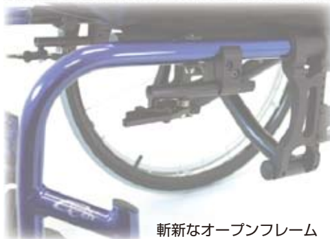
斬新なオープンフレーム